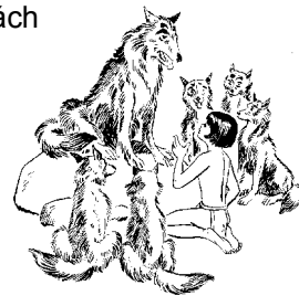
Mowgli before Akela.